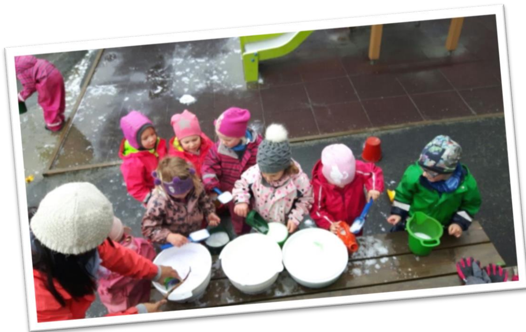
Figur 1 Maizena i vatn,frå barnehagedagen 2019" Eg lurar på"

«Barns undring i leik» blir eit gjennomgåande tema for heile barnehageåret. Me vil legge vekt på barnas undring og nysgjerrigheit gjennom leiken. Me drar med oss tema frå 2018/2019 med eg fann eg fann, og knyt det nærare opp til leiken. Me løftar leiken både inne og ute og opnar for nye tilnærmingar for oss vaksne inn i leiken. Med å setja høgare fokus på leiken og leiken som eit rom for undring set me barnas medverking i leik høgt. Med Askeladdens karaktertrekk med toleranse og omsorg for andre, vert det gode verdirammer for borna.