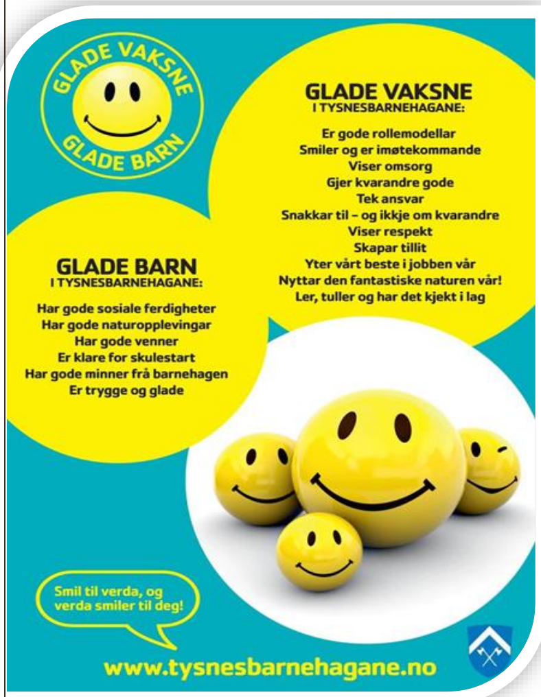
Figur 2 Visjon for Tysnesbarnehagane