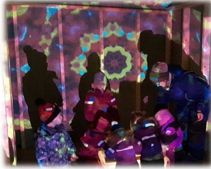
Figur 3 Digital teknologi flytta ut i vognskuret. Barnehagedagen 2019